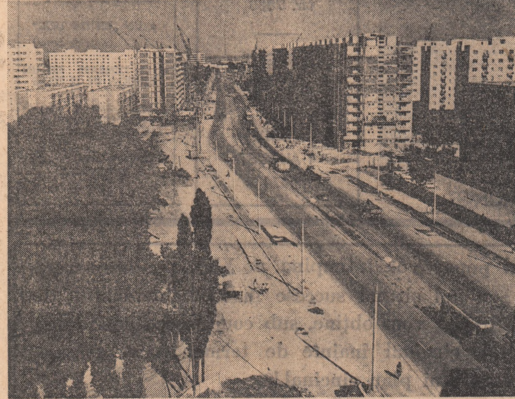
Pe șoseaua Pantelimon - ofensiva constructorilor bucureșteni continuă.

Ministrul comerțului și industriei din Kuveit, Khalid al A-