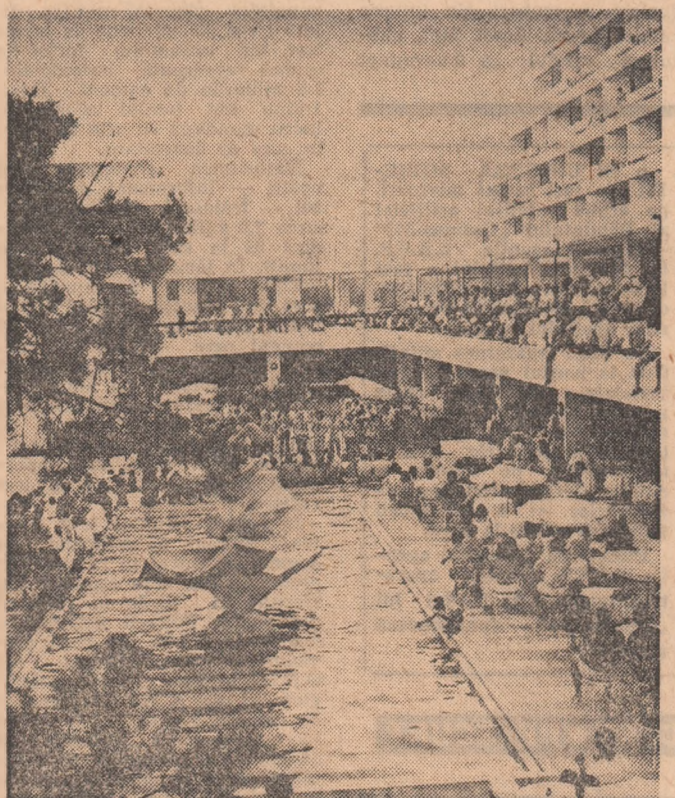
Spectacol improvizat în stațiunea Olimp.