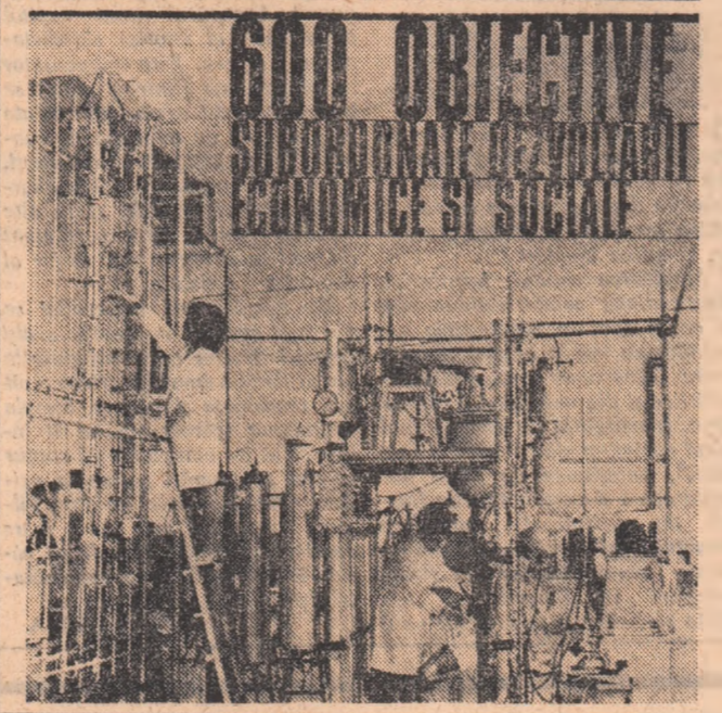
CITITI ÎN PAGINA A III-A

„Societatea socialistă multilateral dezvoltată și comunistă nu pot fi realizate decât pe baza celor mai înalte cuceriri ale științei și culturii. Cîci-nalul viitor trebuie să asigure transformarea radicală, pe bază modernă a întregii noastre industrie, ridicarea calitativă și tehnică a întregii activități economice.