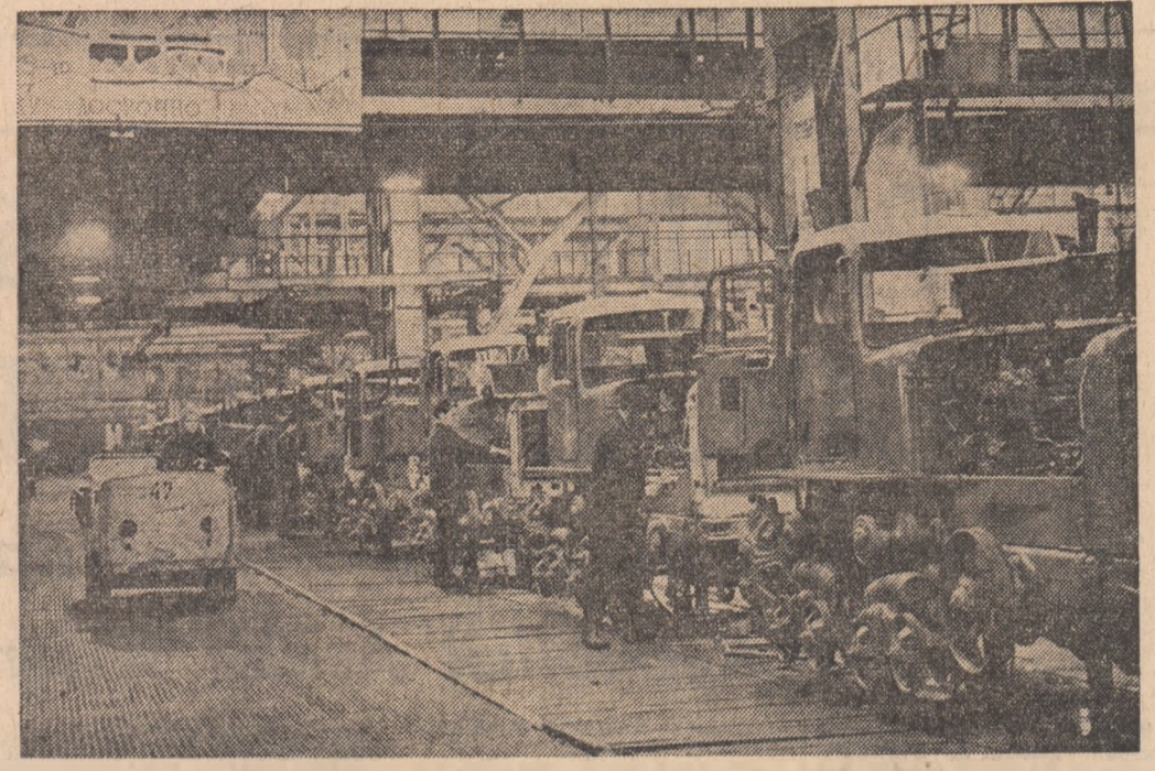
U.R.S.S. Imagine dintr-o uzină de tractoare din Kazahstan.

Republica Panama restabilește relațiile diplomatice cu Cuba