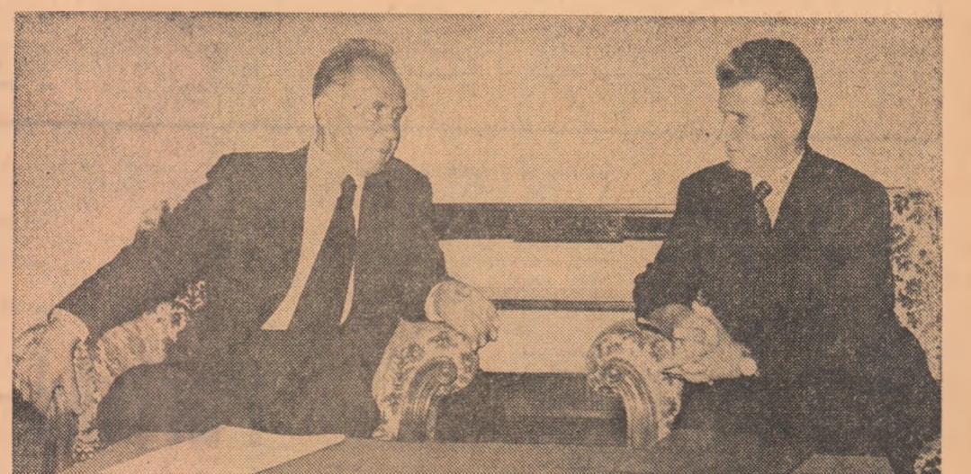
Relatarea primirii în pagina a 6-a

Tovarășul Nicolae Ceaușescu a primit pe tovarășul Alexei Kosîghin, președintele Consiliului de Miniștri al U. R. S. S.