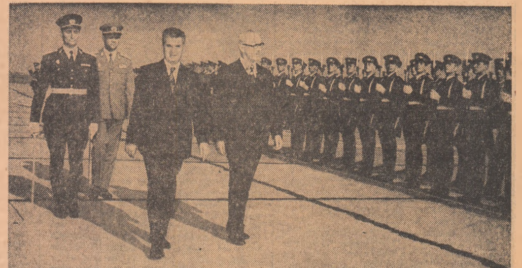
Relatarea sosirii în pagina a 7-a

Sosirea delegației de partid și de stat a R. D. Germane, condusă de tovarășul Willi Stoph