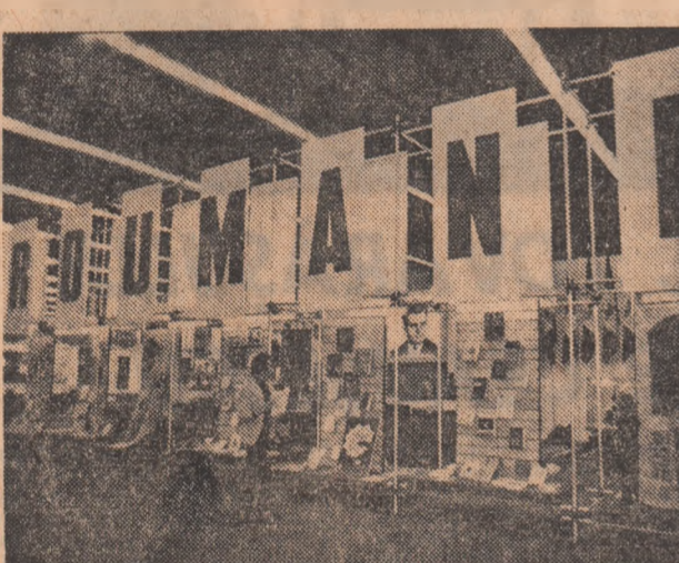
An de an produse tot mai diversificate, mai complexe, purtînd inscripția „Made in Romania”, au devenit tot mai cunoscute, mai apreciate pe meridianele Terrei.