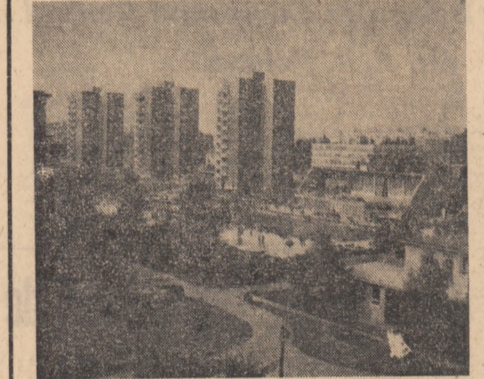
Nou carier de locuințe la Bratislava

Se implinise astăzi trei decenți de la declanșarea insurecției naționale slovac împotriva cotropitorilor hitleristi, evenimente care reprezintă o pagină glorioasă a istoriei Cehoslovaciei. Moment esențial al luptei pentru înlăturarea dominației fascistice, insurecția națională slovacă a marcat intrarea în faza hotărâtoare a rezistenței populare împotriva ocupației naziste. Inițiată și condusă de partidul comunist, insurecția națională slovacă a fost expresia voinței popoarelor ceh și slovac de scuturare a țării de jugul fascist, de restabilirea suveranității naționale și de stat, de libertate și progres social. Rezistența populară antifascistă slovacă începuse să se manifeste în diverse forme încă de la ocuparea și apoi dezmembrearea statului ehoslovac de către nazisti. Formarea, în mai 1942, a primelor grupuri de partizani în Carpații Mici și constituirea în ilegalitate a Consiliului național slovac la sfîrșitul anului 1943 au fost momente de mare importanță