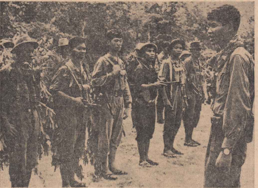
CAMBODGIA : O unitate a forțelor patriotice înainte de plecarea într-o nouă misiune de luptă