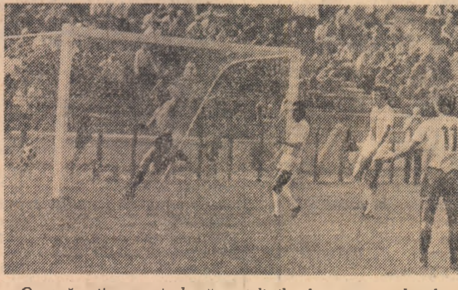
O nouă acțiune periculoasă a steliștilor la poarta studenților timișoreni

Astăzi sosește în țara noastră primul ministru al Republicii Sri Lanka, doamna Sirimavo Ratwate Dias Bandaranaike