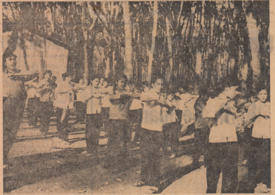
REPUBLICA VIETNAMULUI DE SUD: Elevi ai unei școli din Loc Ninh, provincia eliberată Binh Phouc

La Ambasada Republicii Socialiste România la Belgrad a avut loc o conferință de presă consacrată prezentării lucrării tovarășului Nicolae Ceaușescu „Scrieri alese“, apărută recent în lugoslavia în editura „Komunisti“.