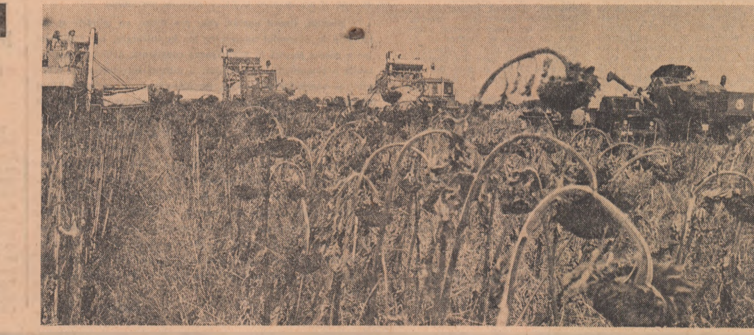
Zilele acestea, la C.A.P. Sinești — Ilfov, s-a recoltat floarea-soarelui de pe ultimele hectare