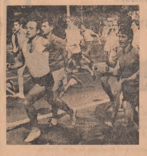
(Continuare în pag. a II-a)

Naționala de fotbal în fața unor mari obiective și răspunderi ● CU HOTĂRIRE, PE UN DRUM DE ÎMPILNIRI ȘI SPERANȚE ● Sportivii români au cucerit două medalii de argint la mondialele de tir ● Comentarii și informații din atletism, handbal, rugbi, divizia B la fotbal (În pagina a 3-a)