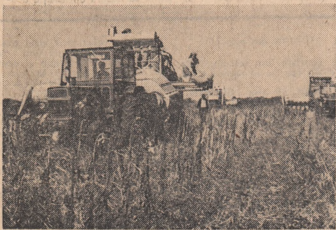
Combinele grăbesc recoltarea florei-soarelei de pe ultimele suprafete.