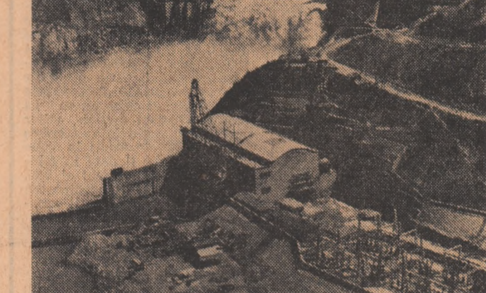
R.P. CHINEZA : Hidrocentrala Huanlunshan, din provincia Hubei, intrată recent în funcțiune.