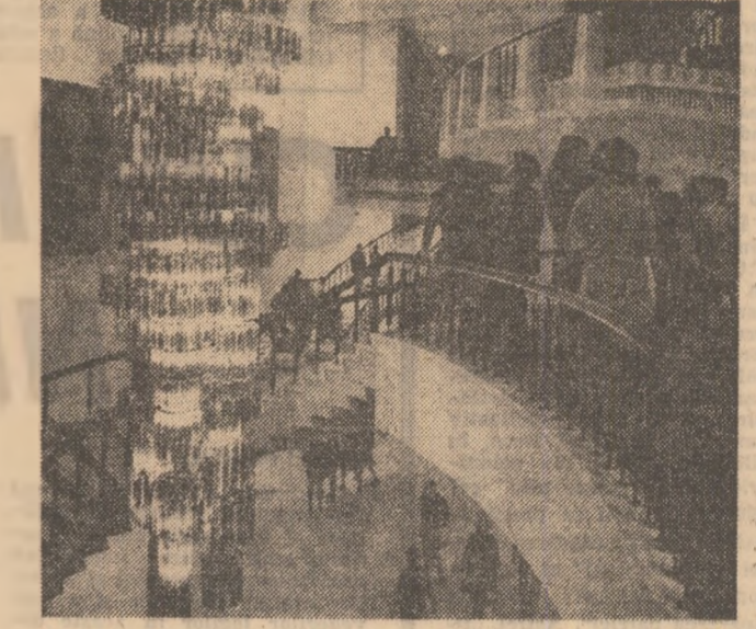
Foaietele Teatrului Național cu tapiseriile lor, au scris de harnum, cu impresionant candelabră au devenit un loc de agreabil și intim pentru iubitorii de teatru...