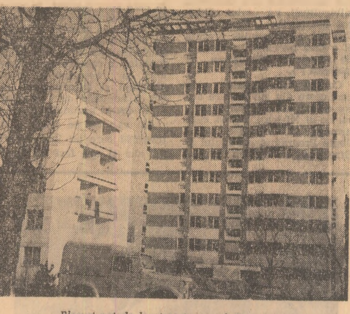
Blocuri noi de locuințe în orașul Botoșani.