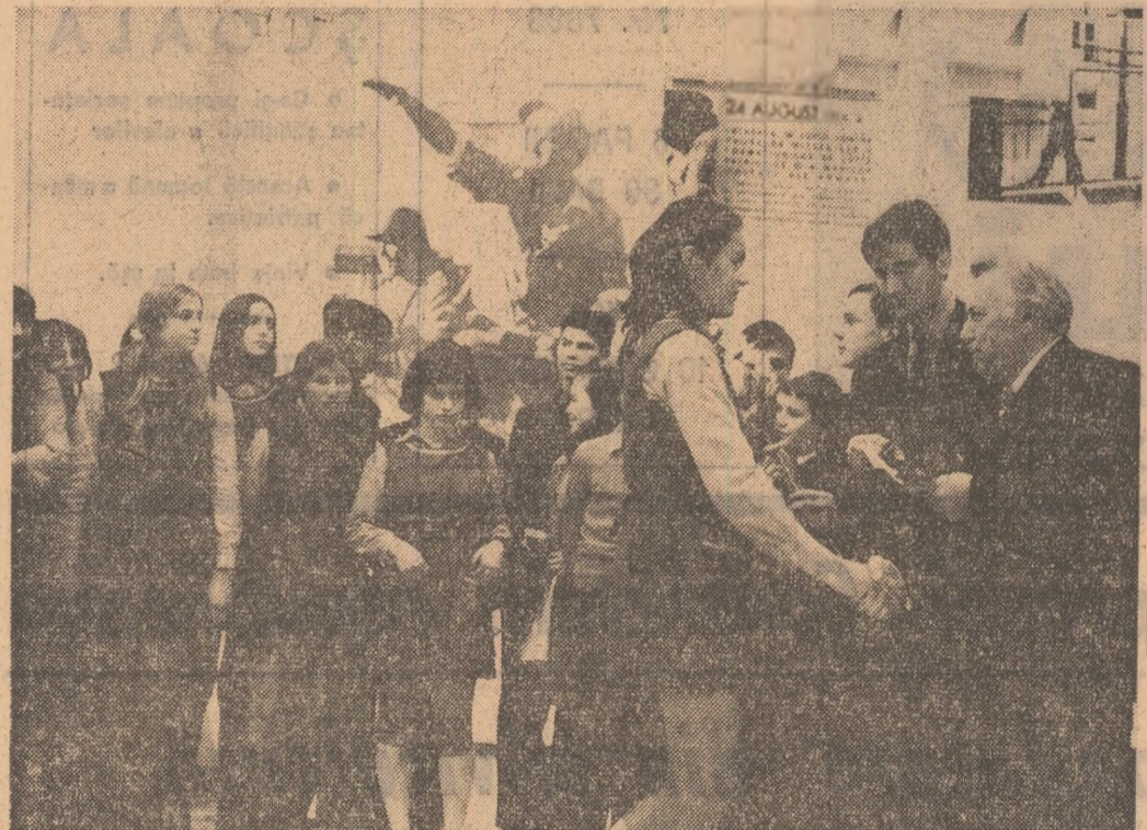
Aseară, la Muzeul de istorie a Partidului Comunist, a mișcării democratice și revoluționare din România, aproape 100 de elevi din școlile bucureștene nr. 172, 17 și 35 au avut cîntea de a li se înmîna carnetul de membru al U.T.C. Ei sînt doar cîțiva dintre tinerii care se bucură de onorarea de a deveni membri ai organizației noastre revoluționare de tineret în preajma celui de-al XI-lea Congres al P.C.R.