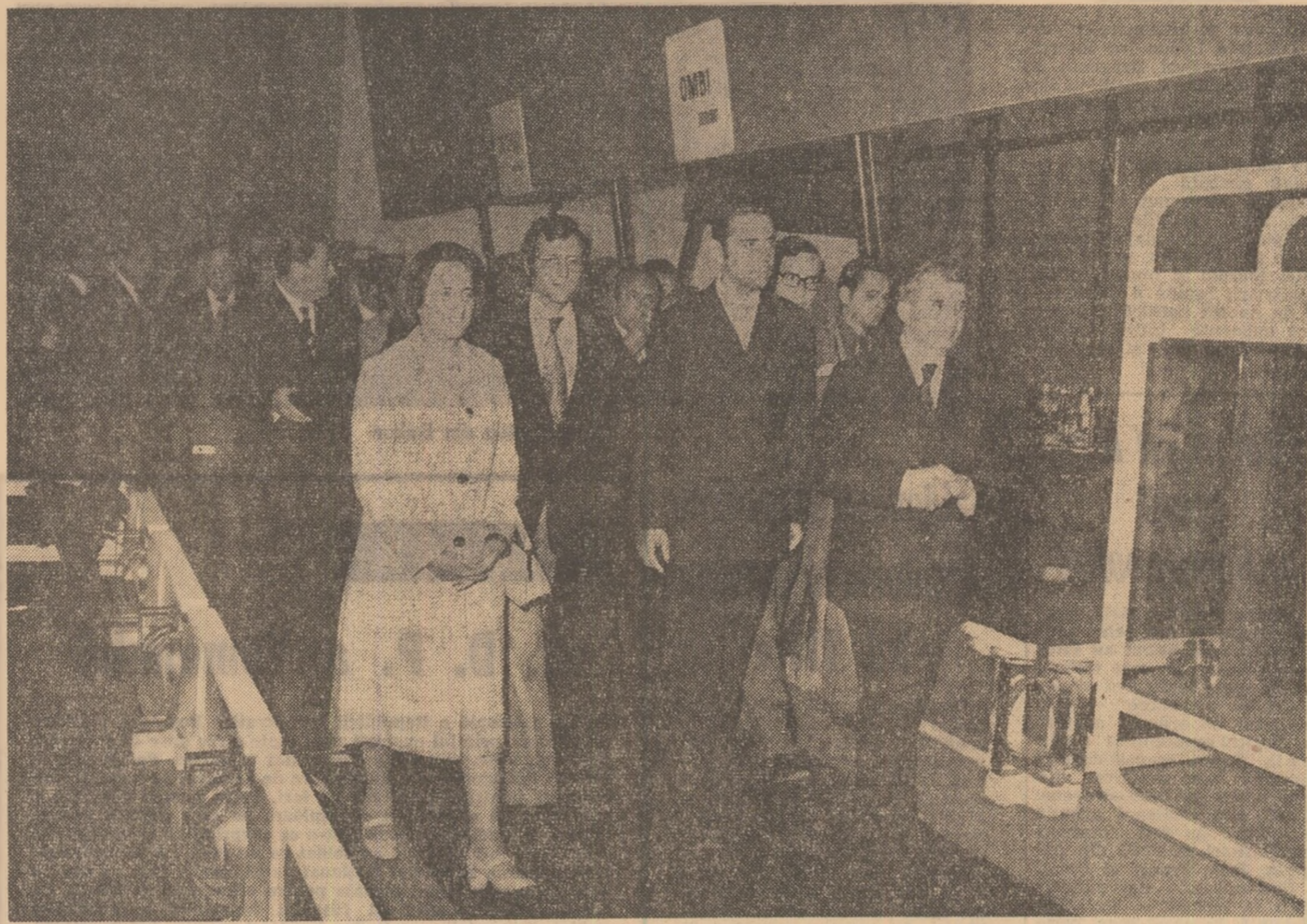
România, a cărei politică economică oferă partenerilor certitudinea unor tranzacții ferme, pe termen lung, terenul favorabil dezvoltării largi, nestingherite, a schimburilor comerciale și a colaborării reciproce avantajoase.

Alături de România, la Tîrgul Internațional București din acest an, sînt etalate produsele, în pavilioane naționale, firme din Anglia, Austria, Belgia, Bulgaria, Cehoslovacia, Danemarca, Elveția, Franța, R. D. Germană, R.F. Germania, Grecia, Irlanda, Israel, Italia, Iugoslavia, Japonia, Olanda, Polonia, S.U.A., Ungaria și U.R.S.S., precum și firme individuale din Liechtenstein, Spania și Suedia. Se remarcă, în primul rînd, participarea constantă a numeroase firme de renume mondială din domeniul producției sau al comercializării, dovadă eloquentă a atracției pe care o exercită industria românească și perspectivele intensificării cooperării cu