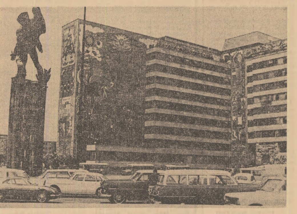
MEXIC: Vedere din capitala țării