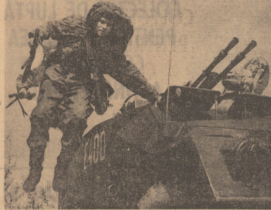
O imagine sugestivă surprînză în timpul îndeplinirii unei misiuni, o imagine care ne vorbește despre măiestria și cetezanja tinerilor militari, despre prăgătirea lor de luptă și politică. Este subiectul pe care-l abordează articolul din pagina a II-a a ziarului nostru: „Fiecare organizație U.T.C. - colectiv de luptă pentru educarea comunistă a tineretului”.