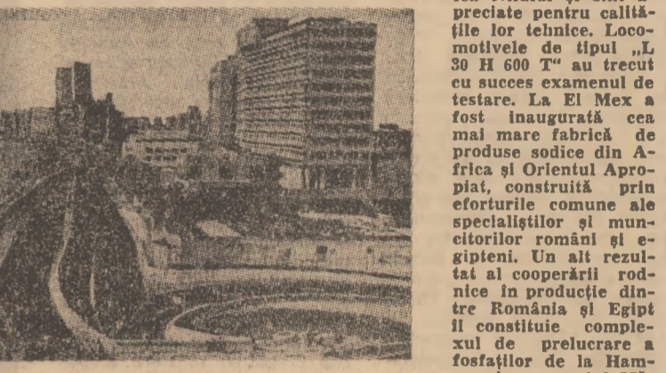
In centrul orașului Cairo