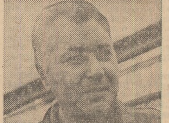
Unorî, cînd una după alta ferestrele se confundă în întineric, unorî, cînd zgornitul înepăr-tat al tramvaielor a luat-o înaintea...