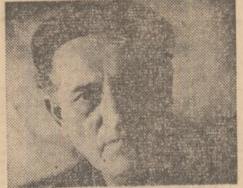
— Eu am lucrat și sub patroni, atunci erau și normal ca să muncă în silă, dar astăzi, o muncă făcută la întimplare...

niștilor de la Grivița. „Pe umeri tăi, mi-ai spus, apasă responsabilitatea îndeplinirii planului uzinei, nu te mira, e un adevăr valabil pentru fiecare dintre noi...”