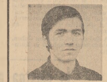
Cel mai eficient instrument al autoeducării