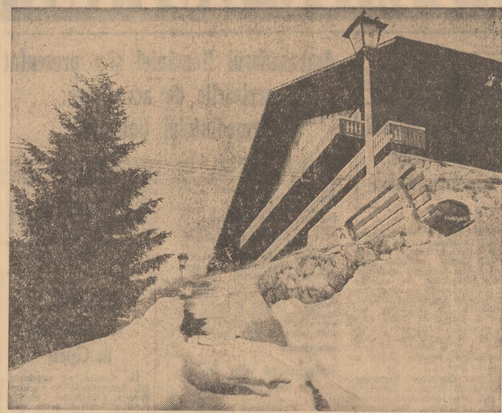
Iarna la Păltinș

Rolul expoziției în contextul actualului Zile ale culturii so-