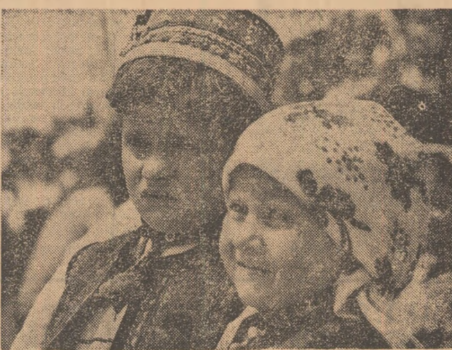
DAMENII: misterul se deslășăiează în strîmtura intrării în Negrești-Oaș. În stînga soselei, cum văd dinspre Satu Mare, se ridică, maiestuoasă, clădirea modernă a întreprinderii „Integrată de in și cîmepă”. Apoi vine orașul. Oșenii spun că există două capitale: Bucureștiul capitala României, și Negrești-Oaș, capitala Țării Oașului. O spun cu o bucurie neașcută și își mai spun că, cu ani în urmă, erau „într-o stare de înapoiere”, ceea ce sună ciudat în neaoșa lor limbă. Ei vorbesc atunci de lipsa școlilor, de lipsa de lucru, de țapînari — singura meserie cît de cît rentabilă — și de dese plecări ale zecilor de familii către alte locuri din țară unde munceau toată vara. Vremurile acelea oșeni nu le uită. Nu se pot uita! Cum nu pot