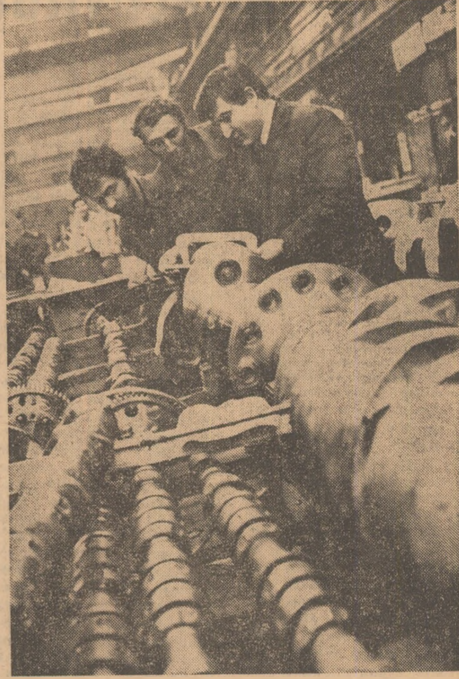
Precizie și îndemnare — calități ce definesc activitatea colectivului de la I.M.M.R. — Craiova.

Curse cu aproape un trimestru mai devreme Colectivul exploatare miniere Filipcești de Pădure, unitate care și-a îndeplinit cu aproape un trimestru mai devreme sarcinile pe anii 1971-1974, a livrat termocentralelor ultimele cantități de lignit prevăzute în angajamentul asumat pe anul în