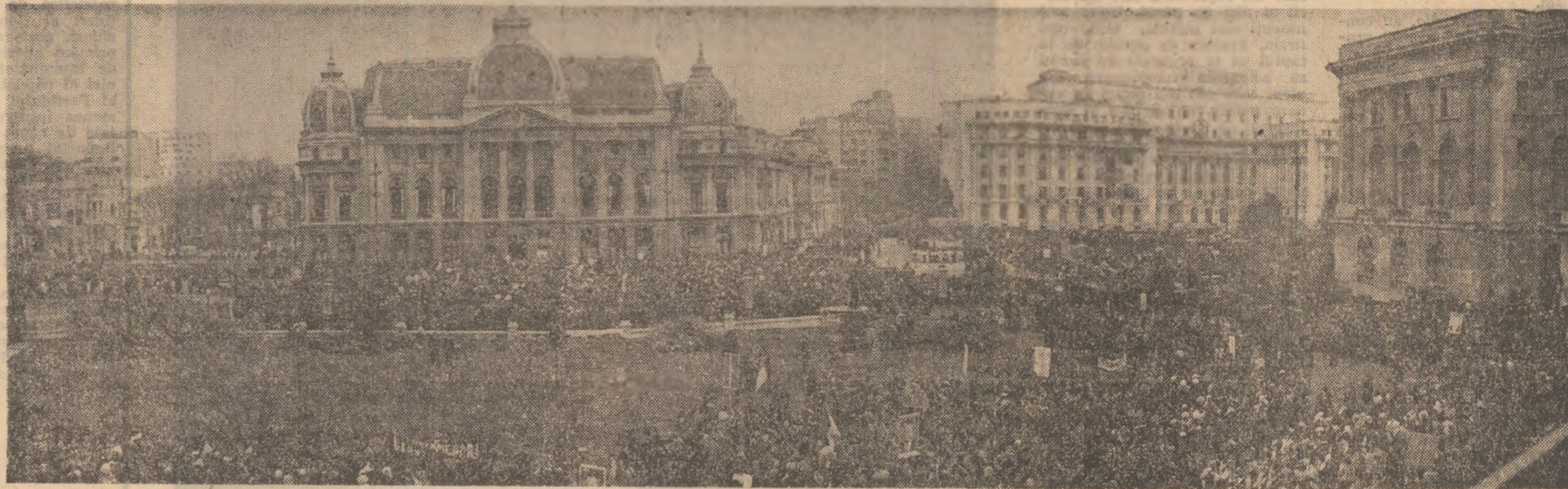
BUCUREȘTI, PIAȚA REPUBLICII, 28 NOIEMBRIE 1974

Atmosfera caracteristică evenimentelor de seamă din viața poporului și a țării. Zeci de mii de locuitori ai Capitalei — oameni de toate vîrstele și profesiile, muncitori, intelectuali, studenți și elevi — participă la o mare adunare populară, trăind cu imensă satisfacție și mîndrie patriotică momentul istoric al realegerii tovarășului Nicolae Ceaușescu în funcția de secretar general al partidului, al încheierii lucrărilor marelui forum al comunistilor români.