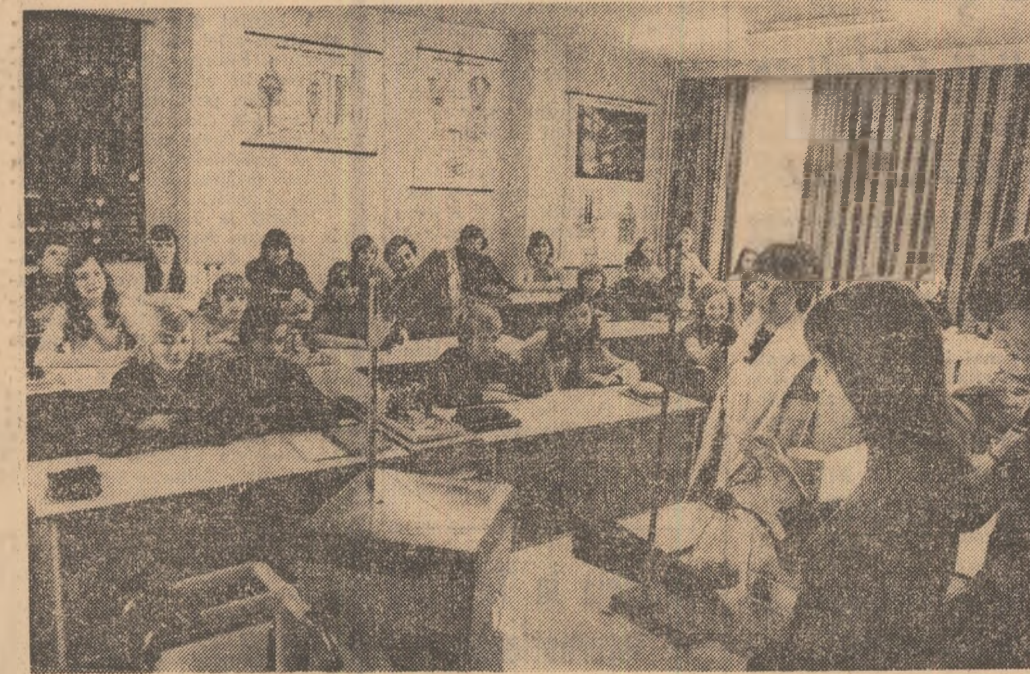
R. D. GERMANĂ : în laboratorul unei școli generale din orașul Schwerin.