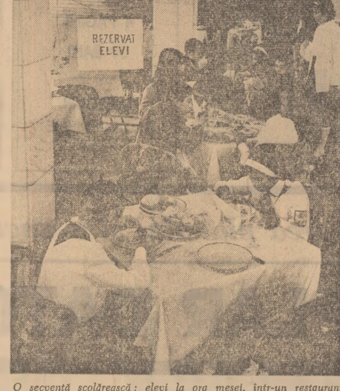
O secvență școlară: elevii la ora mesei, într-un restaurant care le rezervă locuri.