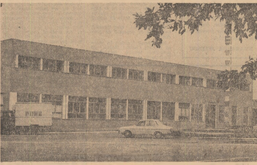
Noua întreprindere de ambalaje metalice pentru agricultură și industria alimentară din orașul Tecuci

În județul Vâlcea: ● AMPLA ACȚIUNI DE FERTILIZARE A SOLULUI ● PE ȘANTIERELE DE ÎNBUNĂȚĂRI FUNCIONARE — TINERII O PREZENTĂ NOTABILĂ ● ÎN LIVEZI RITMUL LUCRĂRILOR POATE FI INTENSIFICAT