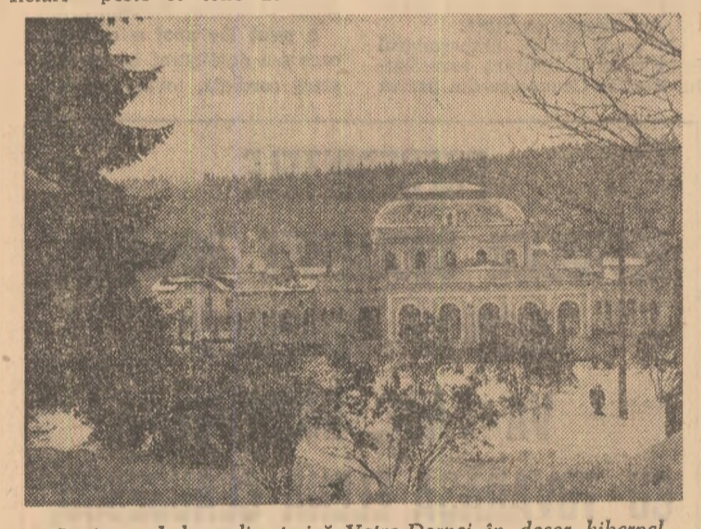
Stațiunea balneo-climaterică Vatra-Dornei în decor hibernal

Cîteva propuneri cu caracter general: introducerea cursurilor de specialitate cu cel puțin un semestru înaintea a unor activități actuale planuri de învățămînt, stabilirea unor programe speciale de matematică aplicativă pe specialități, eliminarea tuturor paralelismelor existente (la discipline cu profil pedagogic, examenul la limbi străine, sporierea numărului de cursuri opționale încă din anul III — sintetizate), dorința studenților de modernizare a activității comitetului învățămîntului, lătură fără de care legătura cu producția nu se poate realiza efectiv conform exigențelor pe care societatea le va avea miine de la studenții de astăzi.