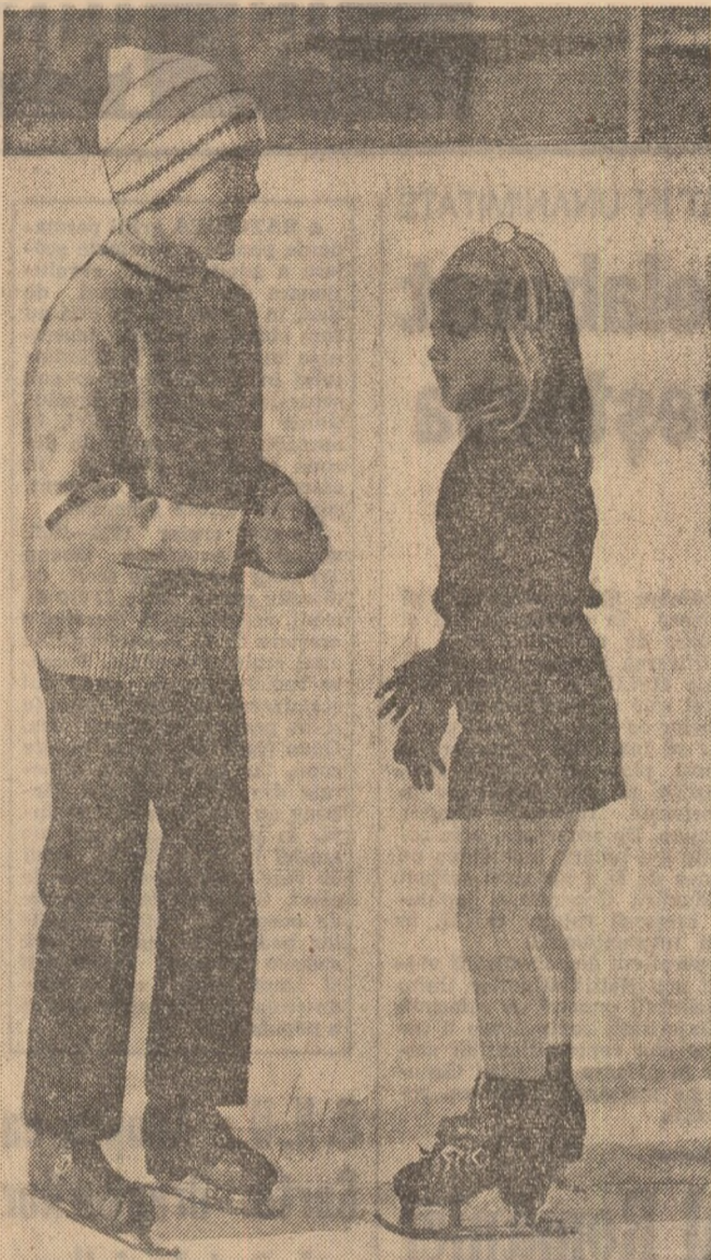
Discuție de sezon