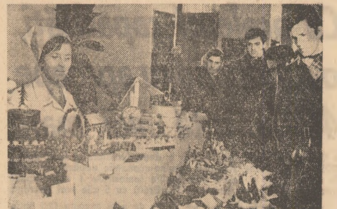
Expoziția cu produse executate de bucatari și cofetari supune examenului publicului măiestria profesională a concurenților.