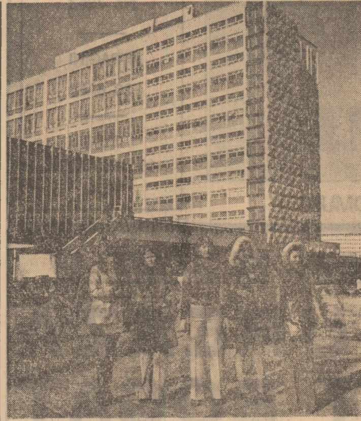
Sezonul de iarnă își pune, firesc, amprenta și pe creațiile ves- timentare. Pentru a veni în timpotimp de noutate a cumpărătoarelor și, mai ales, a cumpărătoarelor, întreprinderea craioveană de confecții a lansat pentru anotimpul rece 300 de noi modele de confecții din care vă prezentăm citeva în foto- grafia de mai sus.

toare, citeva au fost repartizate tinerilor ingineri veniți de cu- rînd în șantier. Este o rezolu- ție provizorie, dar, avînd în ve- dere condițiile, oarecum specia- le, ce li s-au creat, destul de avantaajoasă.