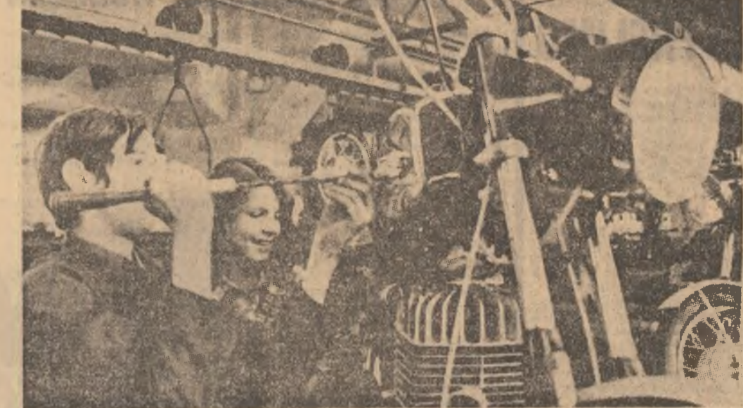
R.D.G. : Tineri muncitori într-o uzină de motociclete din Karl-Marx-Stadt