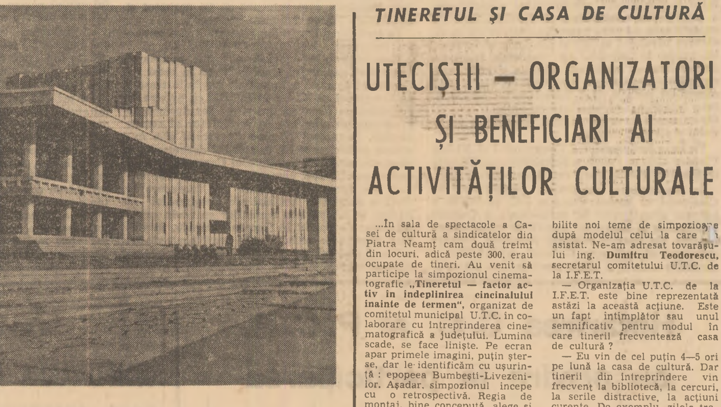
Eleganta clădire a Teatrului Național din Craiova