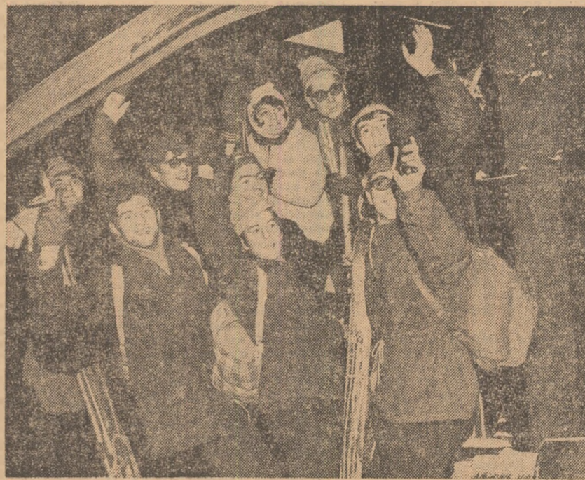
Primul tren al vacanței, avînd ca destinație taberele din stațiunile montane ale Văii Prahovei