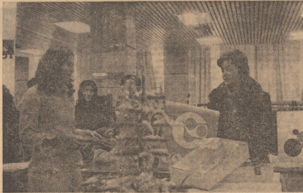
În magazinul „Cocor” din Capitală.

Și atunci, într-o încercare de a-ți deplăcut propria personalitate înțelegi că fără să vrei și-ai ocupat ființa de o anumită țesătură pentru un domeniu sau altul al științei sau culturii, te-ai deprins să lucrezi într-un anumit spirit și-ai putut realiza în timpurile unuia propriu, să te stabilești valoarea lor reală în raport cu ceea ce au însemnat ei pentru tine.