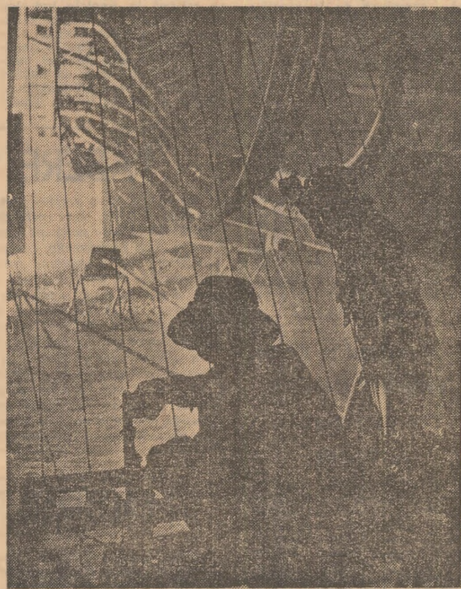
R.P.D. COREEANA: Muncitorii Combinatului „8 Februarie” obțin noi și însemnate succese în muncă

Schimburile comerciale, culturale și tehnico-științifice ale Republicii Panama cu țările socialiste sunt pozitive — a declarat, în cadrul unei conferințe de presă organizate la Ciudad de Panama, premierul Omar Torrijos. S-a realizat o deschidere culturală, comercială cu aceste țări, avem noi piețe și o bună asistență tehnică, precum și un real ajutor din partea lor — a precizat primul ministru panamez, subliniind că guvernul său își rezervă dreptul suveran de a-și alege prietenii și a nu permite nimănui să se amestece în treburile interne ale statului Panama.