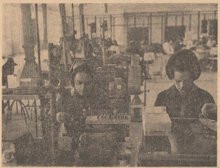
Aspect cotidian din întreprinderea de aparate radio „Tehnoton”-dași, intrată în funcțiune la 1 octombrie 1974 cu 33 la sută din capacitate, și la care se fac probe tehnologice pentru intrarea în producție la întreaga capacitate

Adăugîndu-le peste aceste măsuri se găsește rezerva de eforturi comună a inginerilor, tehnicienilor și muncitorilor pentru găsirea unor soluții de maximă eficacitate în creșterea producției. Așa s-a născut ideea reorganizării procesului de fabricație a „diafragmelor” — piese intermediare care hotărăsc, de fapt, productivitatea utilajelor de la secția vulcanizare și în