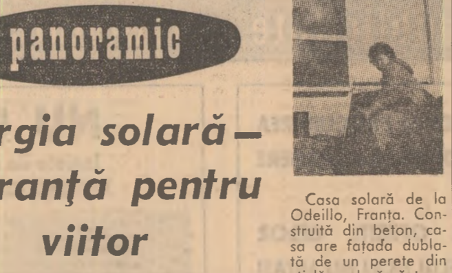
Casa solară de la Odeillo, Franța, care are fatada dublată de un perete din sticlă ce lasă să treacă razele soarelui...