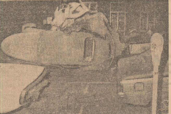
ANGLIA: Urmările unui din recente atentate cu bombe la Londra