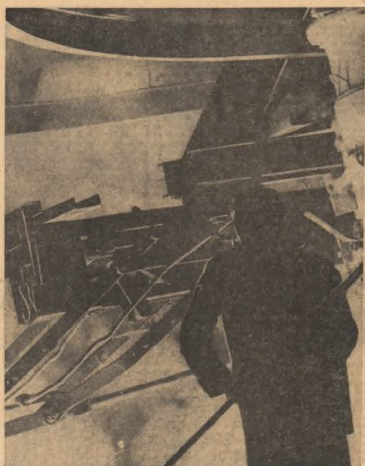
ION CHIRIC (Continuare în pag. a III-a)

Constructorii de pe platforma Combinatului siderurgic din Galați se regrează în prezent spre un nou și deosebit de important obiectiv: primul furnal de 2700 mc, cel mai mare agregat de acest fel din țară. În vârstă de la cel de-al patrulea furnal de 1700 mc care se pregătește să primească în curând hotezul focului, de la alte obiective aflate în faze înaintate de construcție. Începerea lucrărilor la înălțarea acestui furnal constituie un bun prilej pentru muncitorii, maistrii și inginerii de la întreprinderea de construcții și instalații siderurgice, pentru tinerii siderurgiciști de aici ca, în climatul de eferveșcență creat prin eforturile tuturor celor ce muncesc în scopul îndeplinirii planului înalte de termeni, să se înscrie cu noi fapte de semnificație majoră în realizarea sarcinilor trasate de Congresul al XI-lea al partidului privind sporirea eficienței economice și creșterea producției de metal. Constructorii siderurgiciști gălățeni, cei care au ridicat celelalte patru furnale de aici, fiecare de câte 1700 mc, modernele laminare și oțelării, vor susține aici încă un examen al competenței și înaltei calificări. Noul furnal va avea un volum util de 2700 mc, cu 1000 mc mai mult decât cele construite aici până acum, fiind prevăzut pentru o capacitate de producție de 1.850.000 tone fontă pe an, adică o cantitate aproape