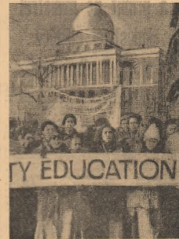
S.U.A. Demonstrația pe străzile Bostonului împotriva segregării rasiilor în școli

Luând cuvântul în cadrul lucrărilor Comisiei pentru Afaceri Externe a Adunării Naționale a Franței, ministrul de Intermedieri, Jean Sauvagnargues, a prezentat un bilanț al ultimelor șase luni de activitate diplomatică franceză. Sauvagnargues a arătat că unul din obiectivele politicii externe franceze a fost întărirea și de a stopa procesul de dezintegrare al Pieței comune, devenit amenințator în 1974. Ministrul francez a subliniat importanța pe care o rapoartă, în această direcție, acordul realizat la reuniunea la nivel înalt a C.E.E., desfășurată la Paris în decembrie 1974, privind întărirea unității economice care permite unui membru al comunității să facă față unei situații dificile.