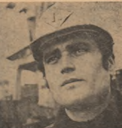
Virtuza meștrilor de meș brăileni este, la această oră, de 23 de ani...

În acest cîncinal, producția globală industrială a crescut de la 6,2 miliarde lei în 1970 la 10,6 miliarde lei în 1975. În anul 1974 a fost realizat un program de investiții în valoare de 2,1 miliarde lei, față de 1,3 miliarde lei în 1970. În anii industrializării socialiste, Brăila și-a dublat populația. Dincolo de acest spor cantitativ trebuie să distingem o creștere a calității umane. Cele 18 întreprinderi de importanță republicană au impus profesii noi, au pregătit oameni noi. Decupăm mai jos câteva secvențe semnificative din aceste zile de amplificat efort și statornică pasiune. ION ANDREIȚĂ ADRIAN VASILESCU IOAN ADAM OREȘTE PLECAN (Continuare în pag. a III-a)