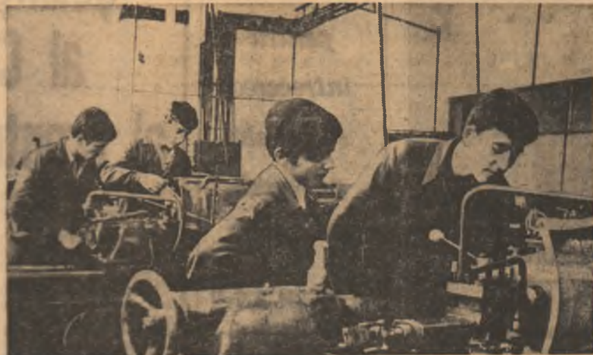
În atelierul școlii de strungărie al Grupului școlar al întreprinderii de autoturisme Pitești.