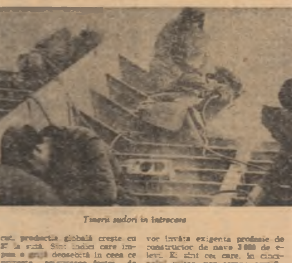
Șantierul naval în întrecere