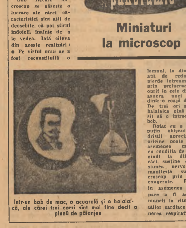
panoramic Miniaturi la microscop

Intr-un bob de mac, o acureauă și o balalaică, ale cărei trei corzi sint mai fine decît o priză de pânjen