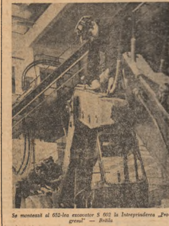
Se montează al 652-lea excavator S 602 la Întreprinderea „Progresul” — Brăila

Aici, la „Progresul” Brăila, cîndva se reparau locomotive. Iar „Progresul” înseamnă, de fapt, cîteva ateliere în care lucrează aproape 200 de cazanji și strungari. Abia în ultimele două decenii a început ascensiunea către ceea ce a devenit azi întreprinderea: o deosebit de importantă unitate economică în care se făuresc mașini și utilaje grele, în care muncă, talentul și inteligența cîtorva mii de oameni au dobîndit faimă internațională. În urmă cu cîteva zile presa a publicat chemarea la întrecere socialistă pe anul 1975 lansată de