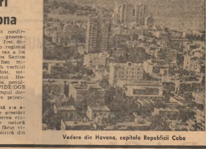
Vedere din Havana, capitala Republicii Cuba

În ultima zi, Parlamentul a adoptat o rezoluție în care respinge propunerile Comisiei Pieței comune privind majorarea în medie cu 9 la sută a prețurilor comune la produsele agricole pentru campania 1975-1976. După opinia exprimată de parlamentari, această majorare este insuficientă. Ea nu este susceptibilă să contribuie la redresarea economică a agriculturilor din Piața comună, care au înregistrat însemnate pierderi în venturile lor, în cursul anului 1974.