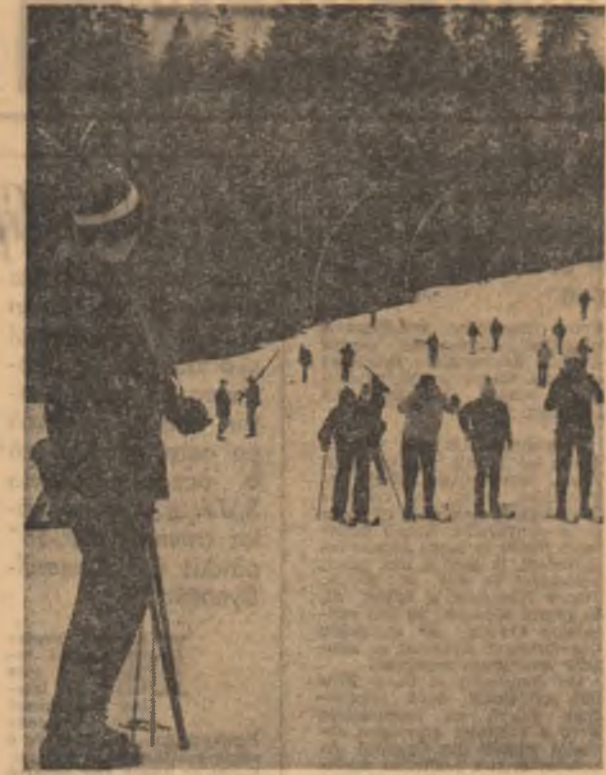
Iarna ne invită, deocamdată, la munte.