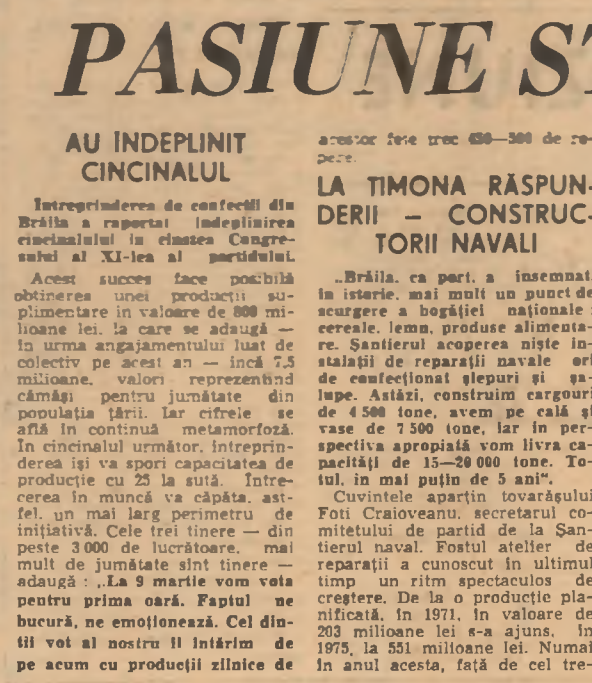
Șantierul naval în întrecere

„Brăila, ca pari, a însemnat, în istorie, mai mult un punct de scurgere a bogăției naționale: cereale, lemn, produse alimentare. Șantierul acoperă niște instalații de reparatii navale ori de confecționare glemuri și galupe. Astăzi, construcția cargourilor de 500 tone, avem pe câlă și vase de 7.500 tone, iar în perspectiva apropiată vom livra capacități de 15-20.000 tone. Total, în mai puțin de 5 ani”. Cuvintele aparțin tovarășului Foti Craioveanu, secretarul comitetului de partid de la Șantierul naval. Fostul atelier de reparatii a cunoscut în ultimul timp un ritm spectaculos de creștere. De la o producție planificată, în 1971, în valoare de 203 milioane lei s-a ajuns, în 1975, la 551 milioane lei. Numai în anul acesta, față de cel tre-