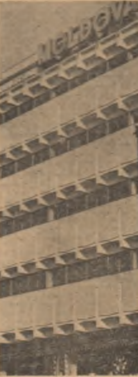
Modernul magazin „Moldova” din Iași