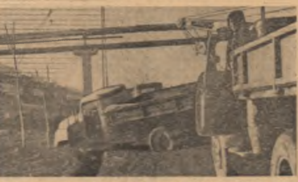
Sistem necesită pe drumurile de incintă blocuri cu diverse materiale aruncate la întâmplare. Șantierul este ferit, totuși, fiindcă a scâlpă numai cu apă.