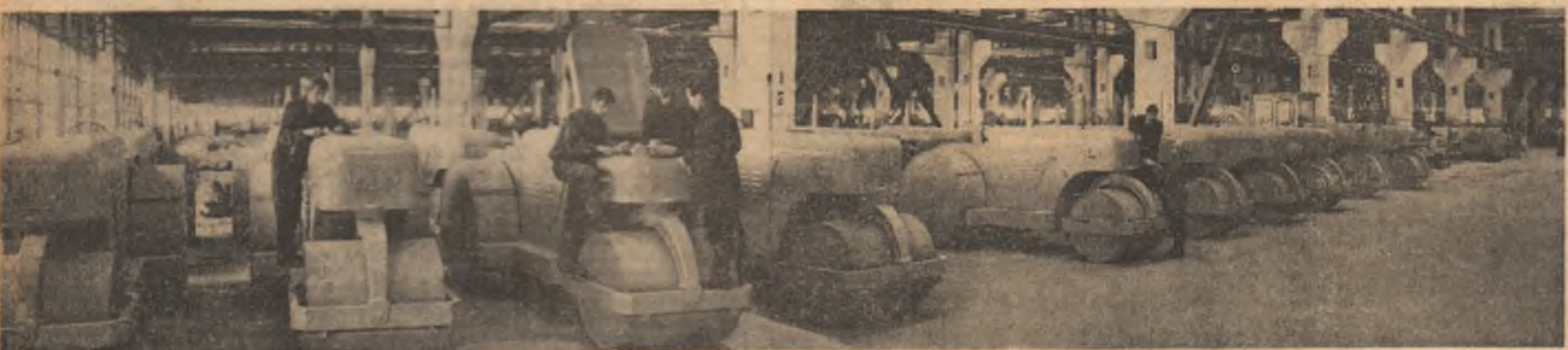
Aspect dintr-o hală de montaj a întreprinderii de utilaj terasier Buzău

LA CASA DE CULTURA DIN RUPEA , la Clubul sanitarului 501 din Brașov, precum și la alte numeroase