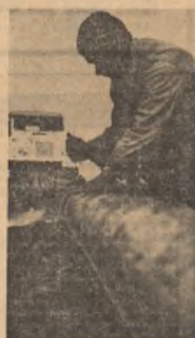
Vremea favorabilă este folosită din plin pentru efectuarea lucrărilor necesare bunei funcționări a amenajărilor existente pe ogoare, astfel că în primăvara totul s-a făcut pregătit, totul s-a mers din plin. Imaginea noastră este elocventă: montarea conductelor pentru aspersoare se desfășoară intens.

Respectarea întocmai a acestor exigențe de producție va conduce implicit la creșterea randamentului la hectar, cu deosebire pe terenurile irigate pentru care se prevăd sarcini deosebite, dintre care amintim: 4.000 kg grâu, 6.250 kg porumb și 2.800 kg floarea-soarelui în I.A.S. și 3.950 kg grâu, 8.000 kg porumb, 2.600 kg floarea-soarelui și 41.000 kg sfeclă de zahăr în C.A.P. Pentru ca valoarea acestor cifre să devină realizabilă, se impune un efort deosebit din partea tuturor lucrătorilor, cooperativizatorilor, mecanicizatorilor, mijlociști, cadre tehnice, specialiști, în sensul organizării muncii și aplicării în practică a măsurilor celor mai eficiente pentru sporirea producțiilor. Sarcina celor 20 de milioane tone cereale revine tuturor unităților agricole, iar împlinirea ei depinde de realizarea în fiecare nucleu de producție a unor recolte cât mai mari. În acest amplu efort de muncă, organizațiile U.T.C. de la sate, toți tinerii care lucrează în agricultură trebuie să participe la acțiunile inițiate în sprijinul producției, materializate prin lucrări de fertilizare, îmbunătățiri funciare, în atelele de reparații la întreținerea și punerea la punct a întregului parcul de mașini și tractoare agricole în așa fel încât să prezinte o perfectă stare de funcționare, la angajarea în acord global a