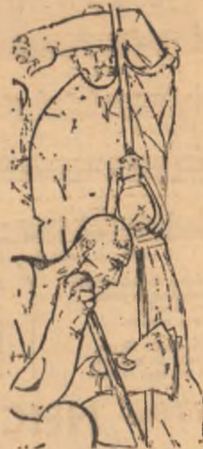
VASILE KAZAR, „Lumină în pădure” (detaliu)