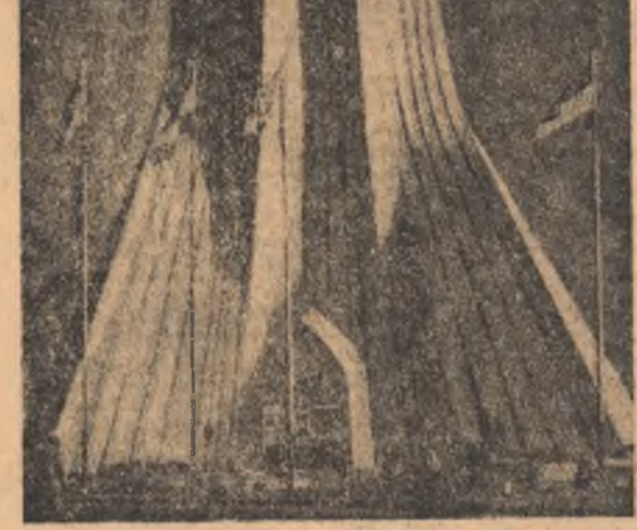
Imagine din Teheran