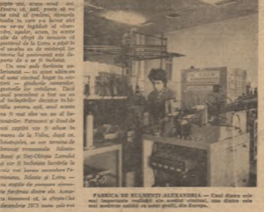
FABRICA DE BULMETURI ALEXANDRIA — Unul dintre cele mai importante realizări ale anului cincinal, una dintre cele mai moderne unități de țară, din Europa.

Cu cîntec lași în vînt, te-levorile aducînd la cunoștință țării o mare succese, cel de al 3-lea hidroagregat de 370 MW al Hidrocentralii de la Lotru a fost ridicat. În sistemul energetic național. Cu acest nou agregat s-a înălțat nivelul de viață a populației din zona Lotru. Cu acest nou agregat s-a înălțat nivelul de viață a populației din zona Lotru. Cu acest nou agregat s-a înălțat nivelul de viață a populației din zona Lotru.