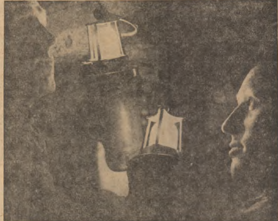
Minerii îi spun „diamant negru”. Astăzi, mai mult ca oricând, nevoile economiei confirmă metafora.

formele ei se află deopotrivă în atenția oamenilor politici, administrației ca și a cercetătorilor științifici. A găsi soluții noi, mai eficiente, a spori valoarea produsului brut, a modifica finalitățile tradiționale cu ajutorul reacțiilor imprevizibile ale chimiei moderne, a optimiza, a matematica, a stabili măsura exactă a consumurilor, iată preocupări constante pentru toate domeniile și în orice punct de pe scoarță. În ceea ce ne privește, Programul P.C.R. de făurire a societății socialiste multilateral dezvoltate și înaintare a României spre comunism, Directivele Congresului XI accentuează sensurile unei politici aplicate cu strictețe de protejare a bogățiilor naturale ale țării, de valorificare superioară a lor. Care este chipul acestor sensuri majore în știință, în cercetare, cum se materializează ele în rezultatele practice ale „intelligenței tinere”? Iată o întrebare căreia îi sint subordonate opiniile publicate în grupajul din această pagină.