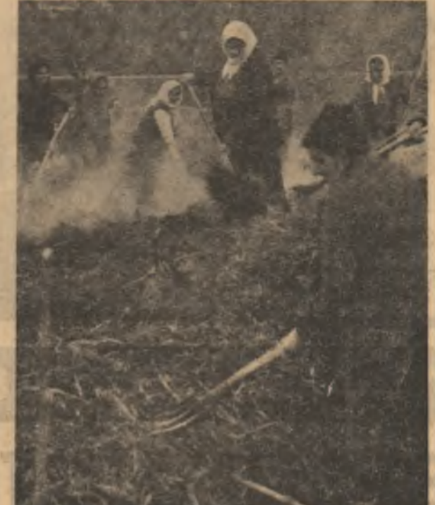
Brigada nr. 4 de la C.A.P. Ceplea, județul Gorj, pregătește paturile calde pentru răsădirile legumicole timpurii

să arătăm că în unele unități agricole care dispun de canale pentru irigații și desecări, acestea sînt rău întreținute, din partea cooperanților nemanifestându-se nici un fel de preocupare pentru aducerea în stare de funcționare. La C.A.P. Totei, de exemplu, canalele de irigații nu sînt curățate, ceea ce va crea mari neajunsuri irigației suprafeței de 100 ha. Situația este și mai îngrijorătoare la C.A.P. Unirea și Cărbun, unde canalele amenajate pentru desecări sînt aproape acoperite cu pămînt iar de-a lungul lor a crescut iarba. Dacă în aceste două unități nu se iau măsuri urgente de decolmatare a canalelor, pe aproximativ 280 ha va bălta cu siguranță apă. Situația întilnită în aceste C.A.P. urile reclamă organizarea unor acțiuni de masă la sate care să ducă în final la folosirea în scop productiv a fiecărei palme de pămînt.