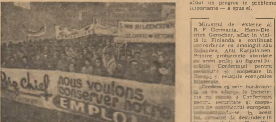
FRANȚA — Salariații de la Big Chief din La Roche-sur-Yon demonstrând în sprijinul revendicărilor lor economice.

Guvernul Republicii Federale Germania speră că lucrările Conferinței pentru securitate și cooperare în Europa vor continua în ritm accelerat, pentru a se încheia cât mai degrabă și cu succes, a relevat în cuvintele de răspuns, Hans-Dietrich Genscher. Sintem convingși că această conferință s-a realizat un progres în probleme importante — a spus el.