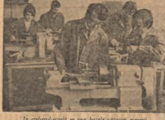
În atelierul-școală se pun bazele tăioarei meserii.