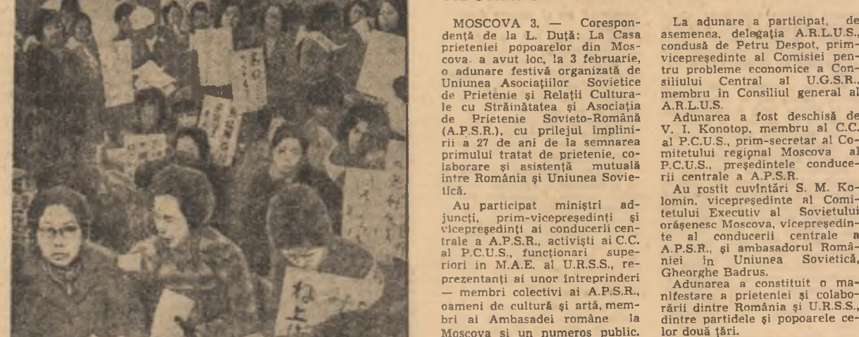
JAPONIA: Aspect de la o recentă demonstrație a femeilor din Tokio împotriva creșterii continue a costului vieții

MOSCOVA 3. — Corespondent de la L. Duță: La Casa prieteniei popoarelor din Moscova a avut loc, la 3 februarie, o adunare festivă organizată de Uniunea Asociațiilor Sovietice de Prietenie și Relații Culturale cu Străinătatea și Asociația de Prietenie Sovieto-Română (A.P.S.R.), cu prilejul împlinirii a 27 de ani de la semnarea primului tratat de prietenie, colaborare și asistență mutuală între România și Uniunea Sovietică.