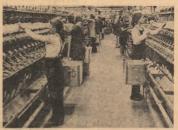
În secția preparării filaturii a întreprinderii textile Slatina.

Întreprinderea de scule din orașul Rîșnov, județul Brașov este socotită pe drept cuvînt, scularul șef al industriei constructive de mașini din țară. Aici tineretea se află la ea acasă: vîrstă medie a colectivului nu depășește 23 de ani! O inițiativă merită să dea noi valori activității celor 1500 de tineri cuprinși în întrecerea „Tineretul — factor activ în îndeplinirea cincinalului înainte de termen” vizează ca la aceeași cantitate de materiale speciale să fie executate lunar 1000 de bucăți de scule în plus, ceea ce reprezintă de fapt 10 la sută din producția lunară a colectivului. „Ideea acestei acțiuni — ne spunea secretarul comitetului U.T.C. al întreprinderii, Mircea Pop — a avut la bază experiența anului trecut cînd colectivul nostru a realizat economia la o serie de materiale pentru scule speciale în