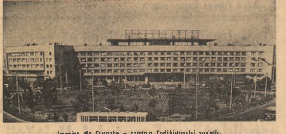
Imagine din Dușanbe - capitolul Republicii Tajikistanului sovietic.

În etapa actuală a luptei sale pentru democrație, poporul sud-coreean respinge farsa „referendumului național” și așa-zisa „constituție revizuală” și cere demisia lui Pak Cijan Hi, subliniază declarația, care arată că întregul popor coreean urmărește cu vigilență intrigile și provocările conducătorilor reacționari sud-coreeni, care urmăresc fascizarea continuă a societății sud-coreene și ridicarea de noi obstacole în calea reunificării naționale. În încheiere, declarația exprimă convingerea că poporul sud-coreean își va îndeplini misiunea și sarcinile care îi revin în perioada actuală a luptei sale.