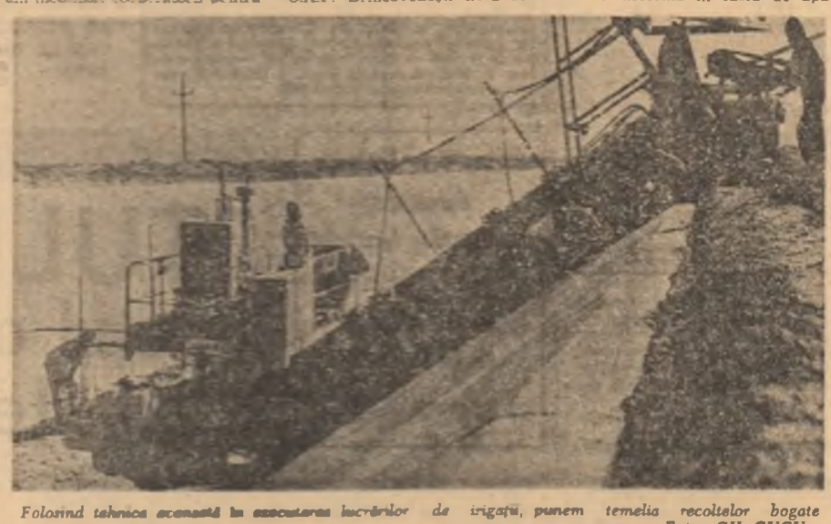
Folosind tehnica scosată în executarea lucrărilor de irigații, punem temelii recoltelor bogate

de forță de muncă. Ne-au dorit-o venenale acțiuni la care am mobilizat cooperatistii pentru