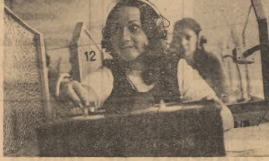
O imagine obișnuită la Institutul pedagogic din Bacău, în modernul laborator de fonetică.

Voi mai afirma că nu o dată omul tânăr de lângă mine m-a făcut să mă gândesc mult de ce năzum atunci. Este ceea ce eu denumesc un influx de energie, de gândire cutuzătoare, de acțiune, pe care fiind dispus să i se însuşești — fără prejudecăți ori resentimente din partea cu provin — izbutesc mai bine pe drumul care duce către culmile Everestului social. Sînt cîteva lucruri la care am avut prilejul să mă gândesc mai deplin și cu ocazia vizitei mele în România unde, la tot pasul, am întîlnit tinerețea în ipostază majoră, de conducător ca și de executor al tuturor activităților economice și sociale din țară. Și mi-am reafirmat din nou vechile mele convingeri că în edificarea noului Congo trebuie să ne bazăm tot mai mult pe oamenii tineri, pe cadrele tinere, pe tot ceea ce înseamnă mai nobil și mai frumos, tinerețea.