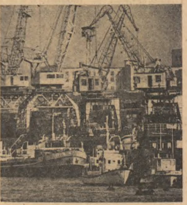
U.R.S.S. — Imagine din portul Novosibirsk.

Reprezentant permanent al Ciprului la O.N.U., Zenon Rossides, a adresat președintelui în funcție al Consiliului de Securitate al O.N.U., Huang Hua (R.P. Chineză), o scrisoare în care se cere convocarea Consiliului de Securitate, în vederea examinării situației din Cipru în contextul hotărârii liderilor ciprioți turci de a proclama în insulă un stat federal separat.