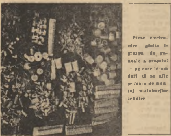
Piese electronice găsite în groapa de gunoale a orașului... pe care le-am doborî și se afle pe masa de montaj a cluburilor tehnice

În fața magazinelor electronice din Capitală se vînd piese de schimb „la doi bani bucate“... „după criterii unele largi și generoase abundente. Cine sînt acei care vînd cu atîtă ardoare și competență...“