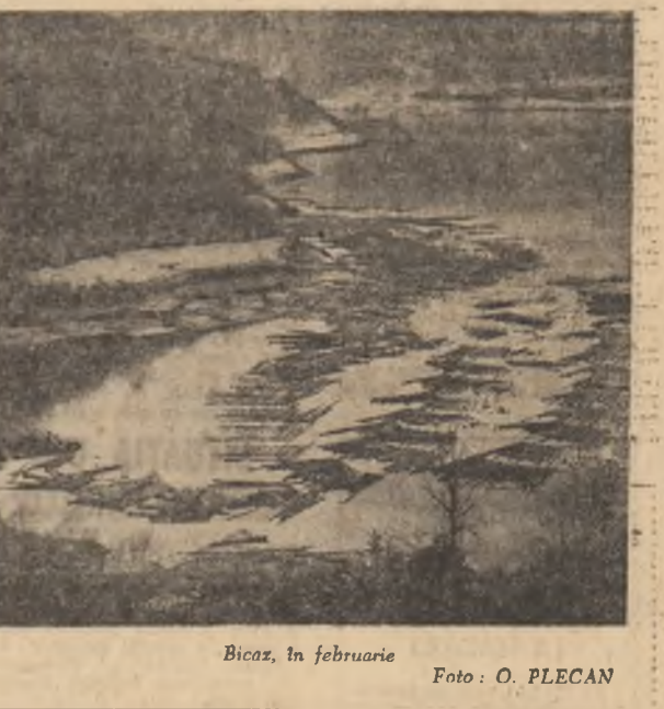
Bicaz, în februarie

tin Pirulescu, vechi militant al mișcării muncitorești din țara noastră, și Ilie Bologa, secretarul Comitetului de partid al întreprinderii „Grivița roșie”. Vorbitorii au înfățișat îndelungată activitate a tovarășului Chivu Stoica în rîndurile mișcării muncitorești revoluționare din țara noastră. Evocînd momente mai importante ale vieții și muncii sale, vorbitorii au subliniat participarea activă a lui Chivu Stoica la desfășurarea eroicelor lupte ale cefierilor din februarie 1933 organizate și conduse de Partidul Comunist Român. A fost relevată contribuția sa în funcțiile de răspundere pe care le-a avut, la întărirea partidului, a unității sale și a rolului său conducător în construcția societății noi, socialiste, la dezvoltarea și consolidarea statului nostru socialist, la înfăptuirea politicii interne și externe a Partidului Comunist Român. După încheierea mitingului de doliu, cortegiul funerar s-a îndreptat spre Monumentul eroilor luptei pentru libertatea poporului și a patriei, pentru socialism, unde j a avut loc înmormarea.