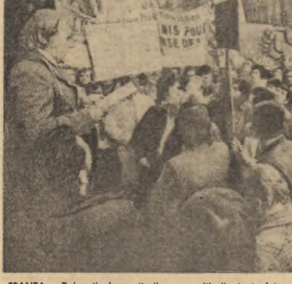
FRANTA - Delegatii ai mesatoriilor proveniti din toate intreprinderile grupului industrial 'Bollora - De Mauduit', au manifestat la Paris cerind incetarea concedierilor si garantarea locurilor de munca