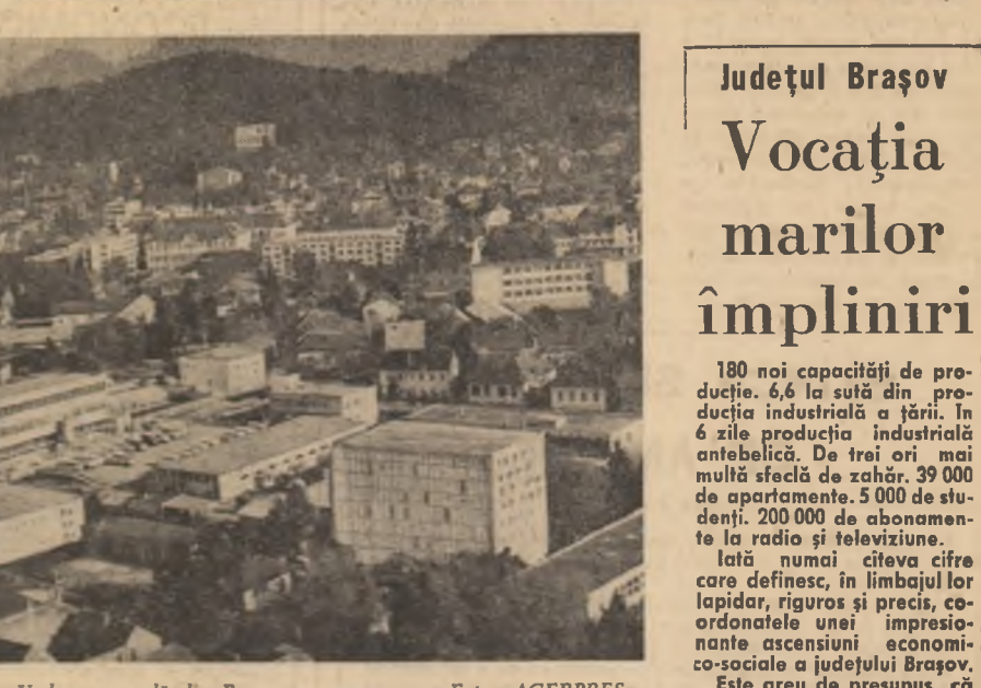
Vedere generală din Brașov