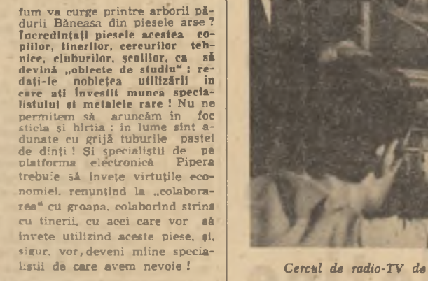
Cercul de radio-TV de la clubul tineretului din Zalău

vã spun cã am înlocuit un program strict de masuri care a început sã prindã viață... ne spune Gh. Bratu, inginerul șef al întreprinderii pentru întreținerea și exploatarea lucrãrilor de îmbunãtãțiri funciare Constantã. În primul rînd am asigurat structura lucrãrilor conform studiilor tehnico-economice. Pentru 1975 am prevãzut cultivarea porumbului pe 40-45 la sutã din suprafațã. În colaborare cu direcția agricolã județeanã și unitãțile beneficiare am controlat deja starea de funcționare a utilajelor, remedierile fiind într-un stadiu de peste 85 la sutã din capacitate. Vrem ca la 1 martie sã declanșãm prima parte a campaniei de irigații.