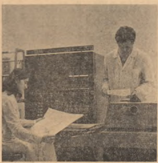
În laboratorul Facultății de cibernetică economică și statistică a Academiei de studii economice din București