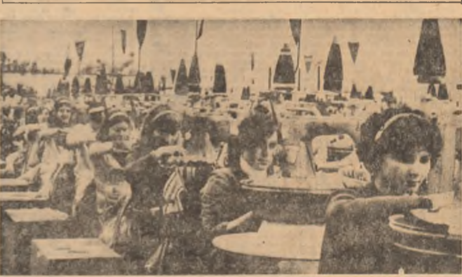
Pe băncile geolilor și ale amfiteatrelor, în întreprinderi și pe ogoare, în munca de cercetare tinerele noastre tovarășe de muncă constituie o prezență activă în timpul afirmării înaltelor virtuți profesionale. Sărbătorim azi tradițional în zi de adresăm urii, din inimă, de viață lungă, de fericire, dorind-le, deopotrivă, noi succese la lucrurile de muncă. În imagine: cele mai tinere frunzose ale secției de confecții coton de la Întreprinderea „Tricovala” din Capitală.

Femele din orașele și satele țării se angajează să înlăture alergiile de deputați în Marea Adunare Națională și în consiliile populare. Important eveniment politic, cu nădejde însoțit de succes în îndeplinirea sarcinilor planului pe anul acesta, în vederea realizării actualului cincinal înainte de termen și a creșterii premiselor pentru trecerea la împlinirea Directivelor de dezvoltare economică-socială a țării în perioada 1976—1980.