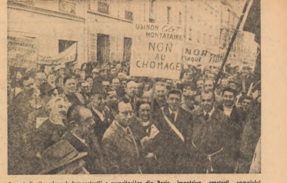
Aspect din timpul unei demonstrații a muncitorilor din Paris împotriva creșterii șomajului