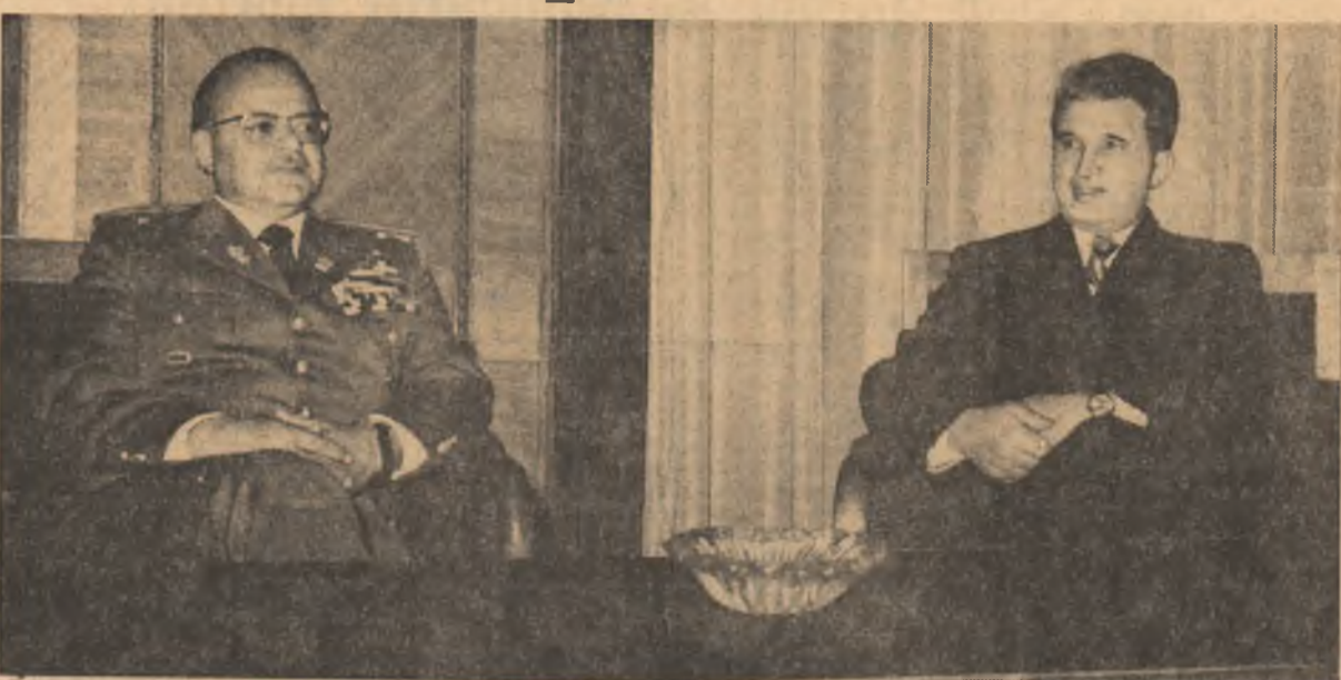
Președintele Guillermo A. Rodríguez Lara a făcut, vineri, după-amiază, la Palatul Republicii, o vizită protocolară la președintele Nicolae Ceaușescu. Au participat tovarășii Ștefan Voitec, Manea Mănescu, Ion Pățan și Ion Ioniță. Cel doi șefi de stat s-au înțeles într-o atmosferă de căldură și prietenie de caracterizată de relațiile dintre țările și popoarele noastre.