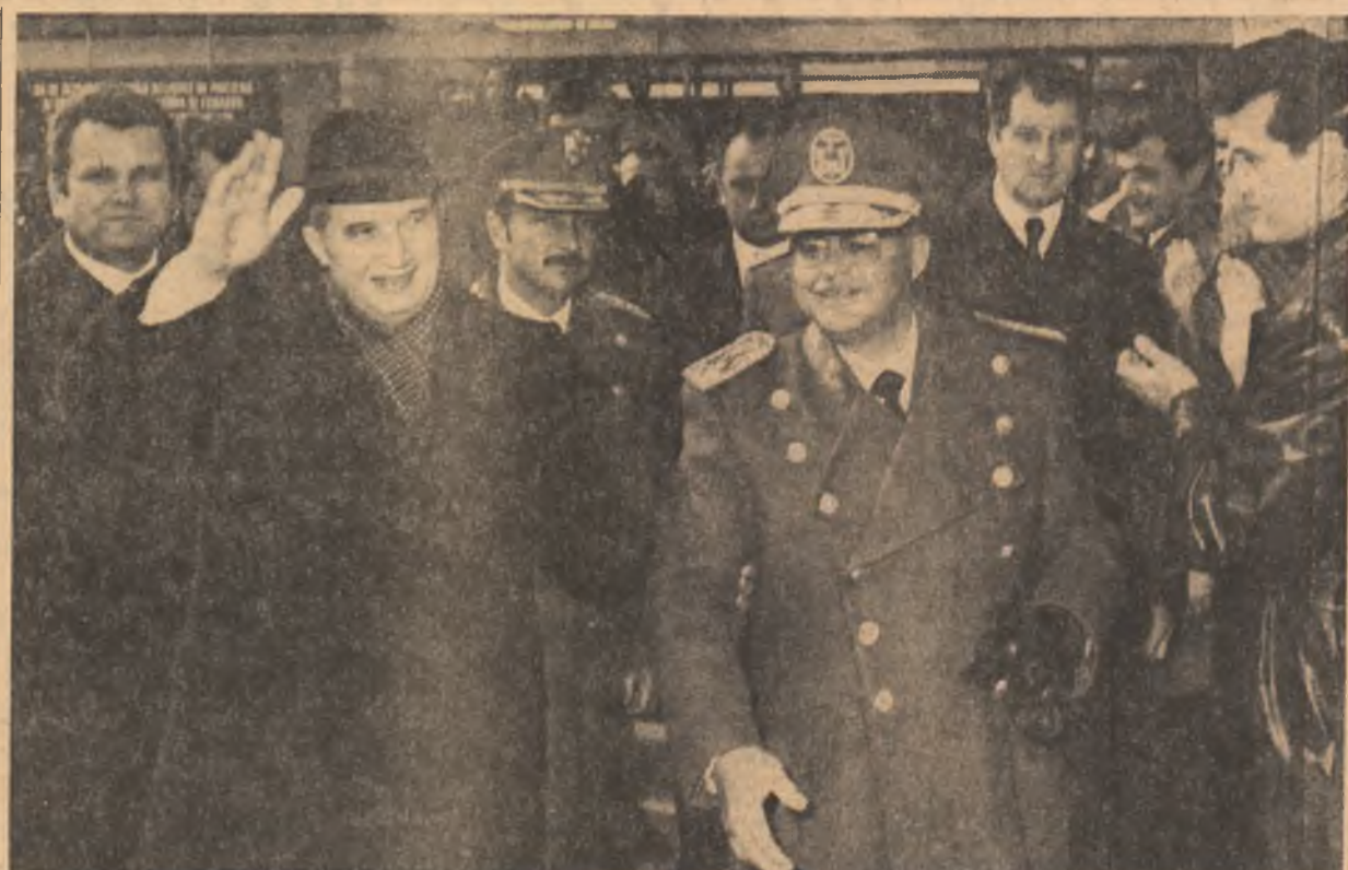
Președintele Nicolae Ceaușescu și președintele Guillermo A. Rodríguez Lara au fost înțeles într-o atmosferă de căldură și prietenie de caracterizată de relațiile dintre țările și popoarele noastre.