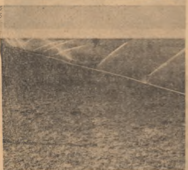
La cooperata agricultura din Dichiseni, aspersoarele funcționează din plin asigurînd suprafețelor cultivate cu lucrări cantitative de apă necesare pentru o producție sporită de furaje.

arse, așteptîndu-se intervenția (rebobinare) L.C.M. Regalia; I.E.L.L.F. Fetești a executat remedierea a 5,8 km igheaburi, în vreme ce alți 30 km (de zece ori mai mult) așteaptă intervenția cooperatorilor agricoli care le au în exploatare (un număr foarte mare de igheaburi — practice nu există o evidență necesară — sînt cîzute de pe furcile de susținere). Se lucrează cu numai 2 utilaje: • lucrările de însoțiment și dezvoltare sînt executate în proporție de 75—85 la sînt. Diferența se află în puncte izolate de lucru, unde, după afirmările forului tîncari nu se realizează o productivitate a muncii sporită. Deci, din cauza „productivității” nu va curge apă?