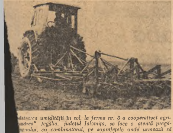
Lucrătorii ogarelor sînt punic mobilizați în aceste zile de cîntarea semănturilor de primăvară...