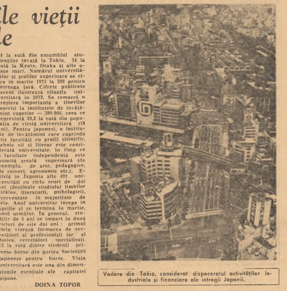
VEDERE DIN TOKIO, considerat dispeccerul activităților industriale și financiare ale întregii Japonii.

Una din materializările fezelelor despre regătura învățămîntului cu viața, cu necesitățile reale ale societății, o constituie perioada cînd guvernul revoluționar al forțelor armate a trecut la stăruirea bazelor economice și sociale ale exploatării, dependentei și subdezvoltării și la o nouă structurare a proprietății. La sate se desfrăzăză sistemul latifundiar care a con-