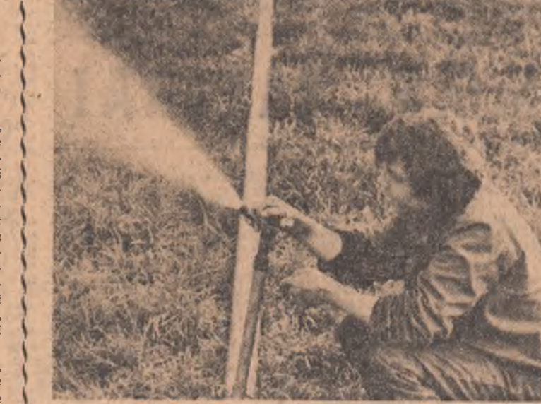
Reșterea de umiditate din sol reclamă, pe terenurile amenajate la irigații, o acțiune susținută pentru udarea culturilor; de aceea motopompele și aspersoarele trebuie să funcționeze fără întrerupere