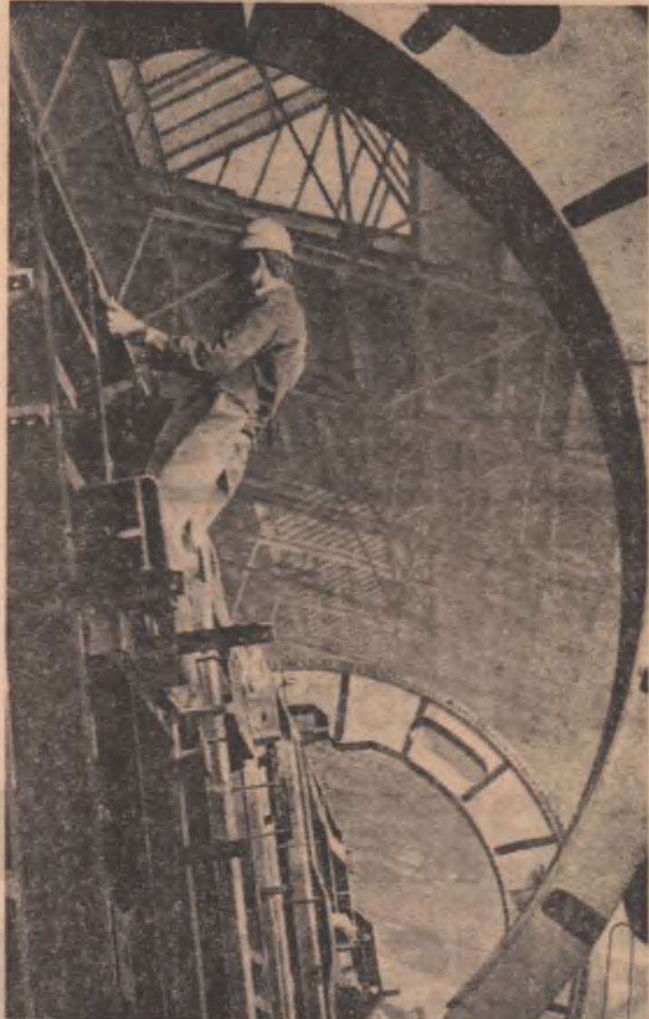
În primele trei luni ale acestui an, la întreprinderea de vagoane din Arad s-a înregistrat indici ridicați de folosire a utilajelor, ceea ce a permis obținerea unor importante sporuri de producție. Ca urmare, pînă la 31 martie colectivul acestei întreprinderi a realizat 60 de vagoane peste plan.