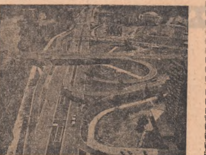
R.P. POLONĂ: Vedere a noului pod varșovian Łazienkowski și a magistralei Wislostrada, date în folosință în cursul anului trecut

școală, relații ce se încheie în contextul evoluției economice. În ciuda faptului că, în trecut, au existat momente de tensiune, în prezent, relațiile dintre cele două țări sunt bune.