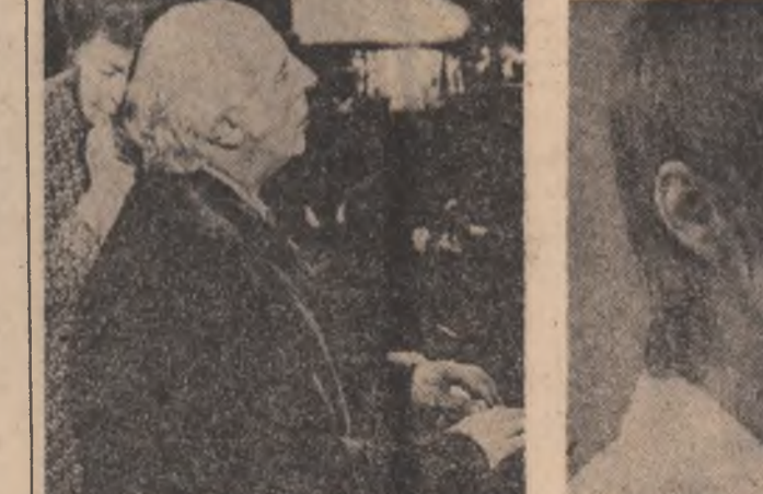
JOC DE PISICI — regia Károly Makk (spectacol de gală)