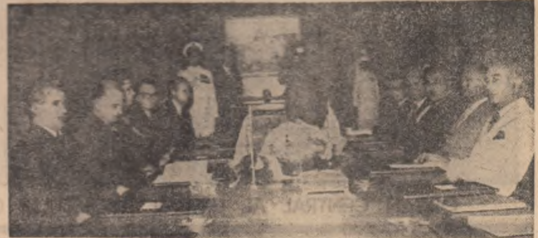
In timpul conorbirilor oficiale, la Casa guvernamentală din Karachi

Ambele părți au subliniat importanța pe care o prezintă contribuția lor la cauza păcii și securității internaționale. Ele au căutat de acord asupra necesității imperative de a se adopta măsuri concrete și eficiente care să conducă la încetarea cursei înarmărilor, la încetarea producției de noi arme nucleare și la distrugerea stocurilor existente, la reducerea bugetelor militare și a trupelor, la desființarea bazelor militare străine și la lichidarea blocurilor militare existente. Părțile au subliniat importanța transformării unor regiuni, cum sint zona Balcanilor sau a Oceanului Indian, în zone de pace și cooperare, lipsite de arme nucleare.