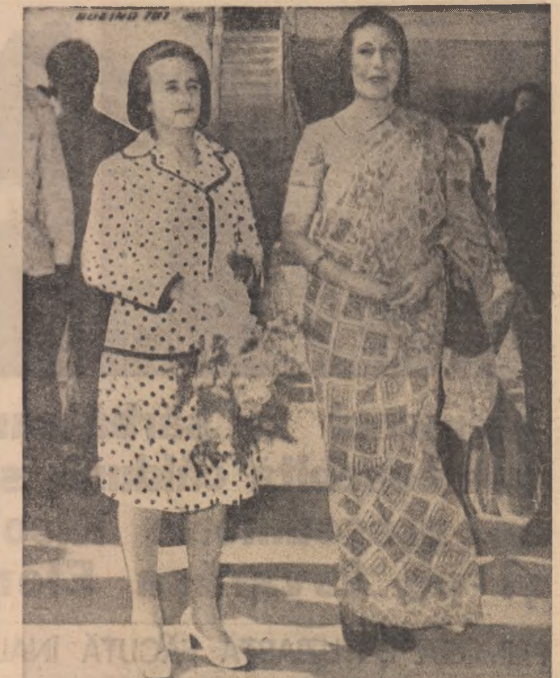
Tovarășă Elena Ceaușescu și doamna Nusrat Bhutto pe aeroportul din Karachi