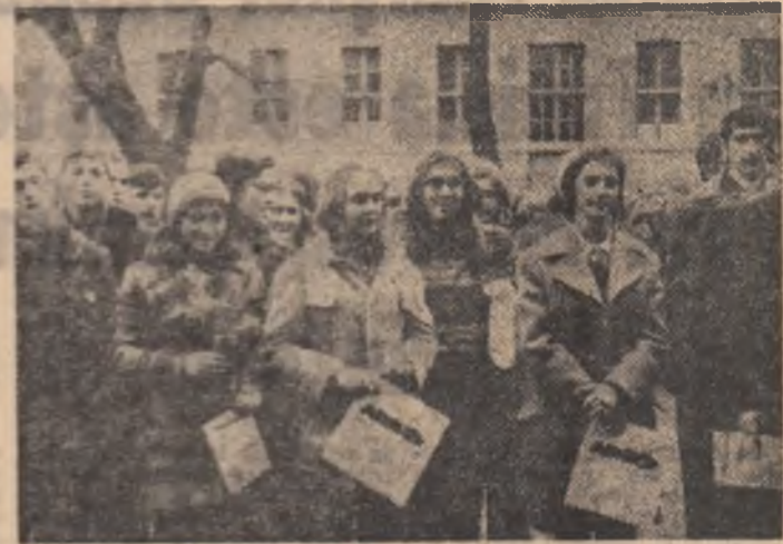
Membrii cercului foto al Liceului „Emanoil Gojdu” din Oradea i-au surprins în timpul festivității de premiere pe câștigătorii recentului concurs sportiv dotat cu Cupa „Gojdu”,

Vacanța de primăvară a constituit, în același timp, prilejul unui fructuos bilanț al activității culturale și patriotice în cadrul cărora tinerii au raportat împlinirea planului pe primul trimestru al anului într-o proporție de 200 la sută. În viziunea și pomnicul s-au evi-