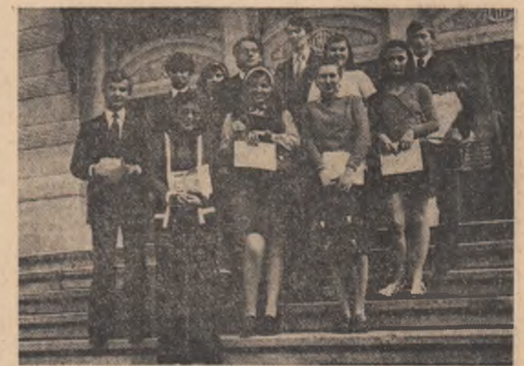
Laureași ai Olimpiadei de biologie, desfășurată în aceste zile de vacanță la Cluj-Napoca.

PLENARA COMITETULUI UNIUNII TINERETULUI COMUNIST AL SECTORULUI 7 DIN MUNICIPIUL BUCUREȘTI